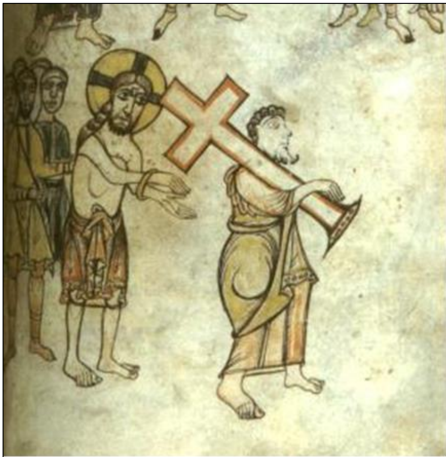
(Codex Angelica 123, Bologna XI secolo)