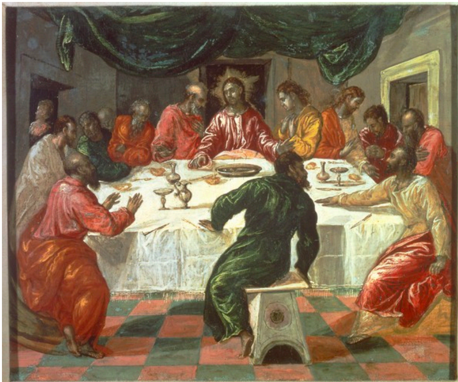
DOMENICO THEOTOKÓPULOS detto EL GRECO (Candia 1541-Toledo 1614) Pinacoteca Nazionale di Bologna

del nostro Signore Gesù Cristo morto, sepolto e risorto