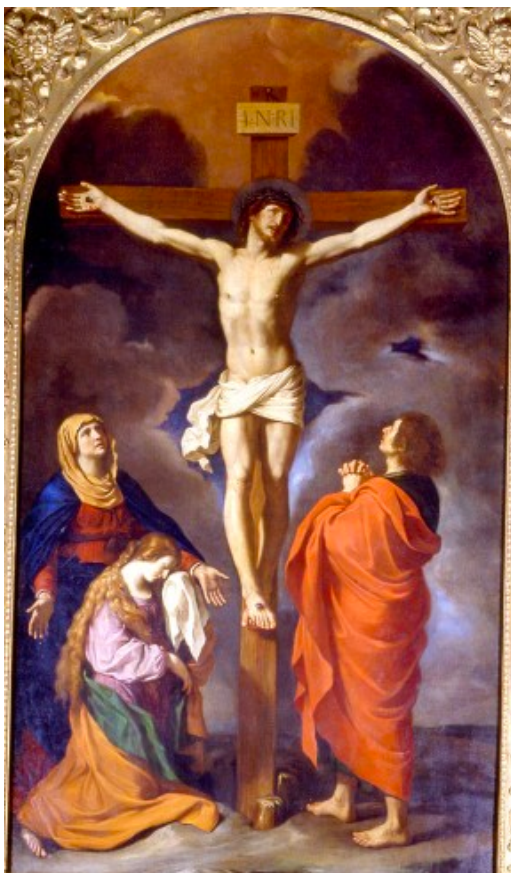
GIOVANNI FRANCESCO BARBIERI detto IL GUERCINO (Cento 1591-Bologna 1666) Chiesa parrocchiale di San Biagio in Cento, FE.

del nostro Signore Gesù Cristo morto, sepolto e risorto