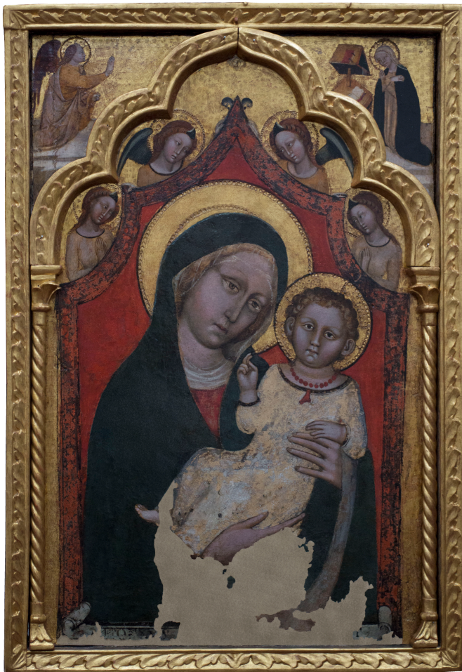
Dipinto Madonna con Bambino. Ambito bolognese sec. XIV. Basilica di Santo Stefano.